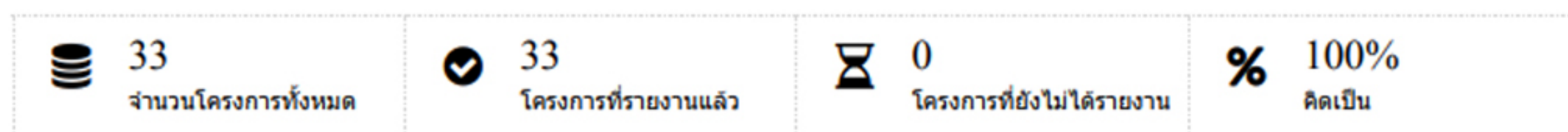
กราฟแสดงภาพรวมโครงการ