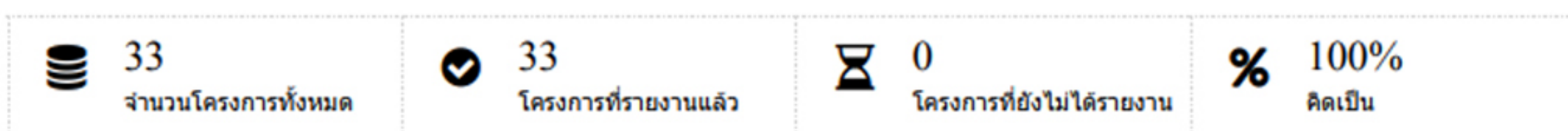
กราฟแสดงภาพรวมโครงการ